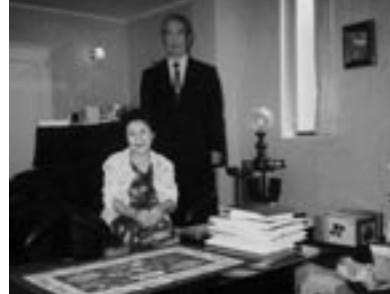
2005年7月14日 会社 応接室にて妻と