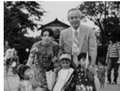
当クラブ高齢者委員会を担当し、保育園の夕涼 み会に施設高齢者の方を招待。保育園児のお母 さんと世話役の私。(4年前)