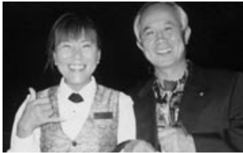
ハワイ・ナイトクルージング 娘の結婚式を終えて 楽しい! うれしい!と 言っていたのに顔は少し淋しそうに見えたのか、 お姉さんから花を頂く。私だけに (5年前)