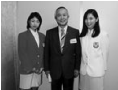
ハッピー・スマイルガール 歯と笑顔が日本一良い方。左優勝者、右準優勝者。 口の中はすばらしくきれいです。(4年前)