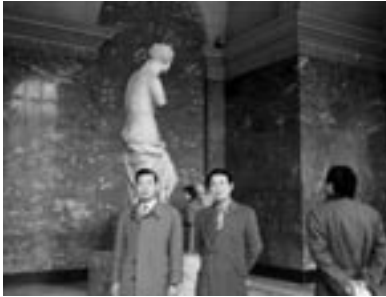
ルーブル美術館 ミロのビーナスの前 (30年くらい前)