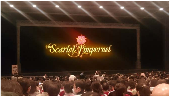
4/11婦人交流研修会 宝塚大歌劇場 神戸三田アウトレット