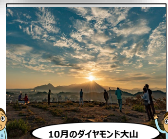
10月のダイヤモンド大山