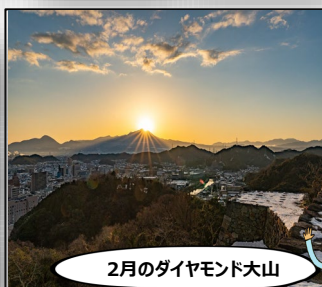
2月のダイヤモンド大山