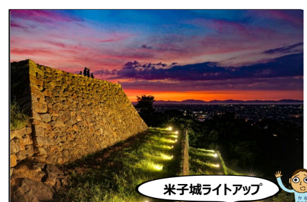
米子城ライトアップ